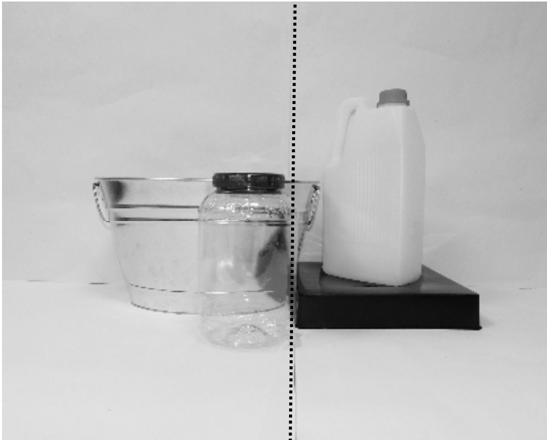
πρώτη φωτογραφία: μπροστινή όψη