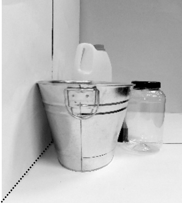
τρίτη φωτογραφία: πλάγια όψη 1